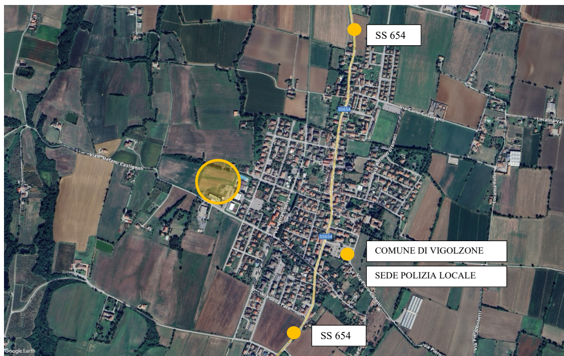
Figura 1 – inquadramento generale in ortofoto